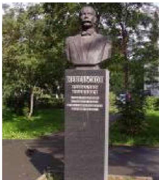
Бюст Г. И. Невельскому в Южно-Сахалинске

25 октября 2013 года в Южно-Сахалинске состоялась торжественная церемония открытия памятника Г. И. Невельскому работы скульптора Александра Устенко и коллектива мастеров подмосковной художественной литейной мастерской «Лит Арт». Памятник высотой в 3, 7 метра установлен недалеко от здания института экономики и востоковедения Сахалинского государственного университета. И это символично – спешащую на занятия молодежь встречает фигура морского офицера Невельского, в руках штормовой плащ. Во всем облике – движение вперед, устремленность к новым свершениям, открытиям; она заразительна.