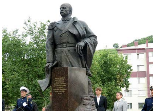
Памятник Г. И. Невельскому в Корсакове

20 июля 2013 г. в Корсакове торжественно открыт памятник адмиралу Г. И. Невельскому, изготовленный в Санкт-Петербурге художником Альбертом Чаркиным.