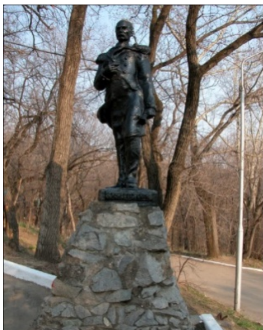
Памятник Г. И. Невельскому в Хабаровске

Высокая компетентность, прямолинейность и честность Г. И. Невельского, самостоятельность его мнений и действий раздражали высокопоставленных лиц, и, как следствие, его деятельность не была оценена по достоинству. После Амурской экспедиции остались невостребованными энергия, знания и опыт еще достаточно молодого Г. И. Невельского. Признание пришло позднее. 26 октября 1897 года во Владивостоке Невельскому и его сподвижникам в торжественной обстановке был открыт сооруженный по всенародной подписке памятник. Впоследствии, в разные годы, памятники Г. И. Невельскому установлены в городах Солигаличе, Николаевске-на-Амуре, Хабаровске, Невельске. Имя Невельского присвоено географическим объектам, музею в г. Солигаличе, Дальневосточному высшему инженерному морскому училищу, улицам, пароходам.