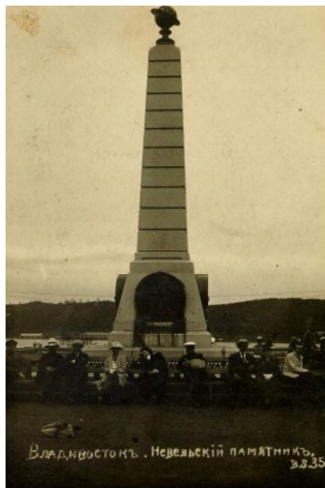
Памятник Г. И. Невельскому во Владивостоке